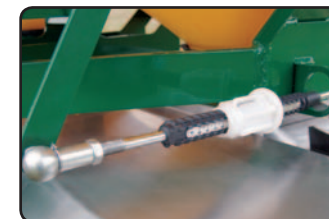
Regulador de cantidad de flujo.