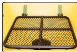
Rejilla protectora con deflector regulable.