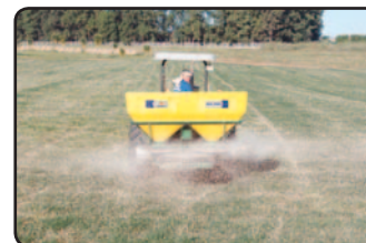
Ancho de trabajo.