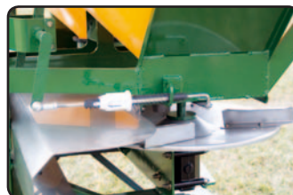
Disco lanzador en acero inoxidable.