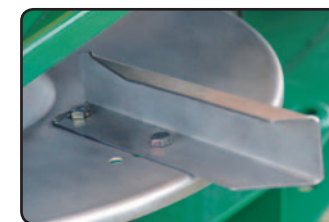
Palas de ángulo variable.