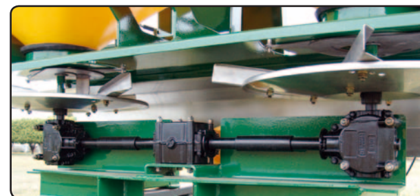
Rotación en el distribuidor: 820 rpm.